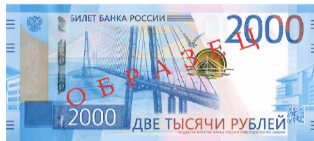
2000 ₺: 2017