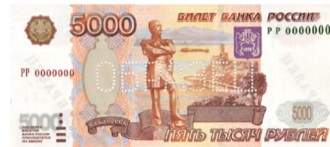
5000 ₺: 1997 , 2010