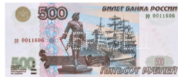
500 ₺: 1997 , 2001 , 2004 , 2010