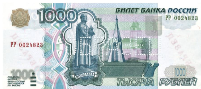
1000 ₺: 1997 , 2004 , 2010