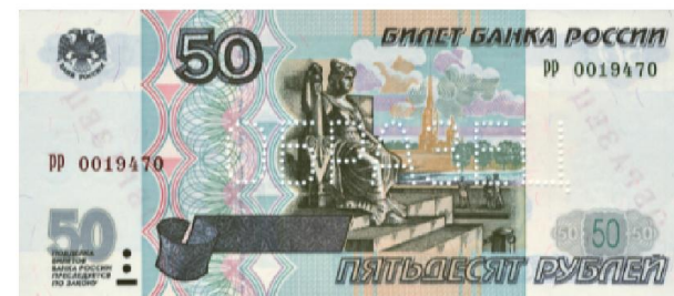
50 ₺: 1997 , 2001 , 2004