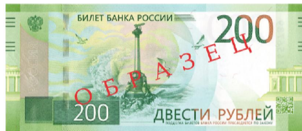
200 ₺: 2017