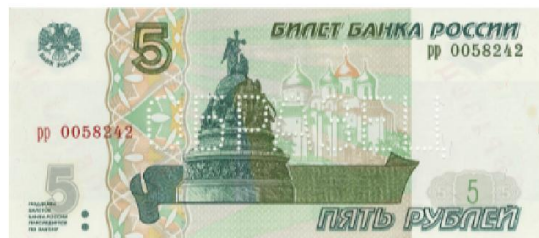
5 ₺: 1997