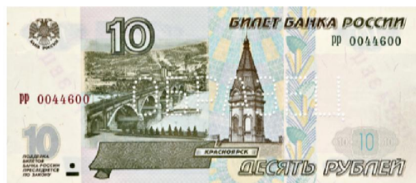
10 ₺: 1997 , 2001 , 2004