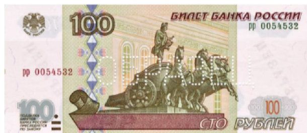
100 ₺: 1997 , 2001 , 2004 , 2014 , 2015 , 2018